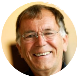
Jan Gehl (Architekt, Stadtplaner)

Die „Recology Genossenschaft“ will in San Francisco das „Zero Waste“-Konzept umsetzen. Bis zum Jahr 2020 sollen 100% der Abfälle recycelt werden – schon heute werden 80% des Mülls wiederverwertet und kompostiert. Recology entwickelt Programme für Restaurants, Haushalte und Unternehmen, um entsprechende Maßnahmen umzusetzen. Dazu kommen steuerliche Anreize: wer weniger Abfall produziert, zahlt weniger Gebühren. Plastiktüten und Verpackungen aus Polystyrol sind komplett verboten, Abfallsündern drohen hohe Geldstrafen. Unter dem Strich hat die „Zero Waste“-Konzept vor allem Vorteile: Schaffung lokaler Arbeitsplätze, Verminderung der Umweltverschmutzung, Einnahmen aus der Kompostierung und eine Stadt, die durch die Einbeziehung ihrer Bewohner belebt wird.