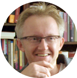
David Van Reybrouck (Historiker, Schriftsteller)

Das gegenwärtige politische System steckt in einer Sackgasse. Immer weniger Bürger gehen wählen, Parteien verschwinden und die Wahlergebnisse entsprechen oft anlassbedingten Launen. Der belgische Historiker und Schriftsteller David van Reybrouck nennt dies das „demokratische Erschöpfungssyndrom“. Um es zu durchbrechen, schlägt er ein Prinzip vor, das im antiken Griechenland beliebt war und heute in Deutschland zum Beispiel bei der Benennung von Schöffen vor Gericht angewandt wird: die Auslosung. Seiner Meinung nach könnte die Möglichkeit des Zufalls in unserem Staatsapparat unsere Demokratie durchaus beleben. In dieser Form einer partizipativen Demokratie könnten ausgeloste Bürger aus allen Schichten gewählte Abgeordnete unterstützen und damit direkt über Dinge mitentscheiden, die uns alle betreffen.